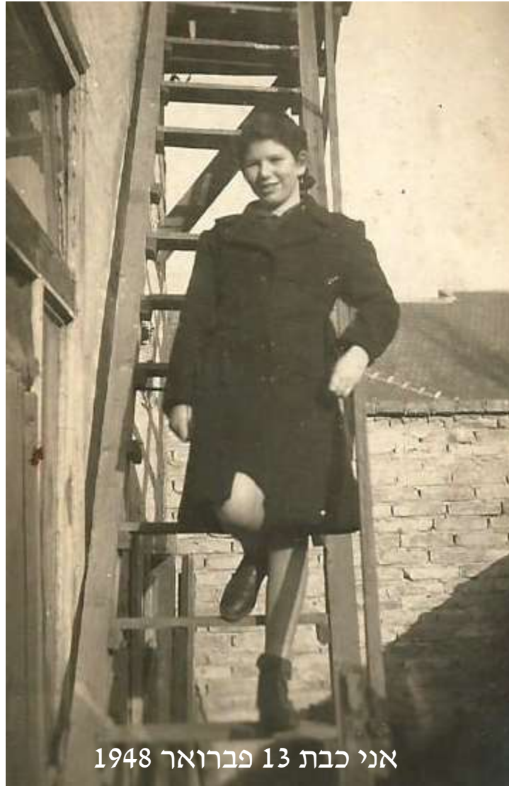
אני כבת 13 פברואר 1948