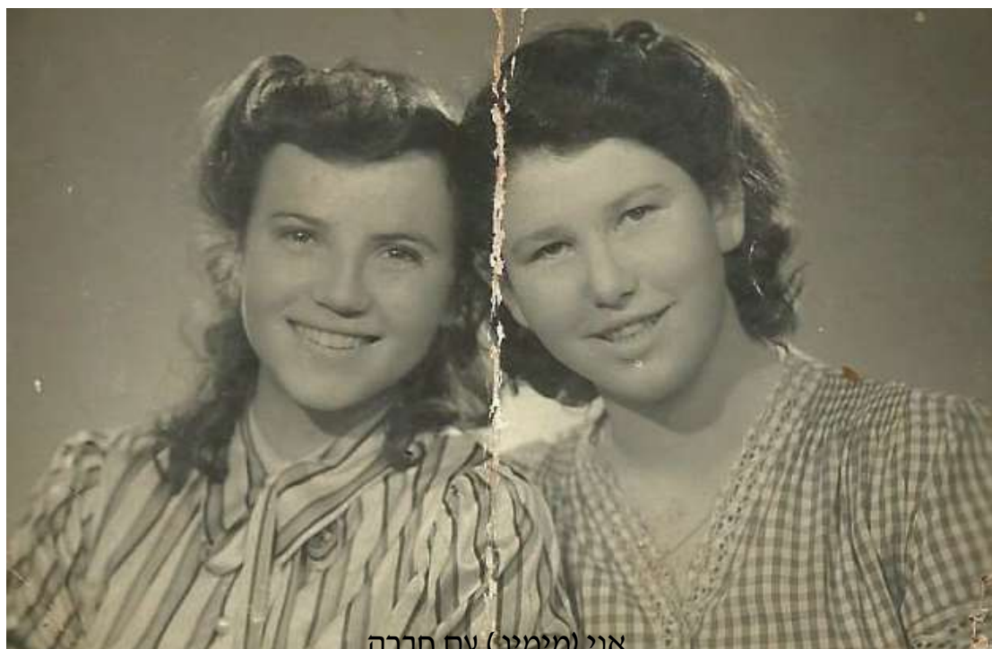
אני (מימין) עם חברה

ניסינו לחזור לשגרה כמה שיותר מהר. אמנם לא היה בית ספר יהודי שיכולנו ללמוד בו. לא היו מספיק ילדים ששרדו את המחנות שהצדיקו פתיחת בית ספר, אבל התארגנו לבד, היינו כמה ילדים מגילאים שונים וברמות שונות שלמדנו יחד באותו חדר. בבית הספר המאולתר שלנו הייתה רק כיתה אחת ומורה אחת שהתנדבה ללמד אותנו. החלטתי שאני מתאמצת ולומדת חומר של כיתה ג' למרות שבעצם לא סיימתי כיתה ב'. למזלי לא דרשו תעודות ואני הצלחתי להתגבר על הפערים.